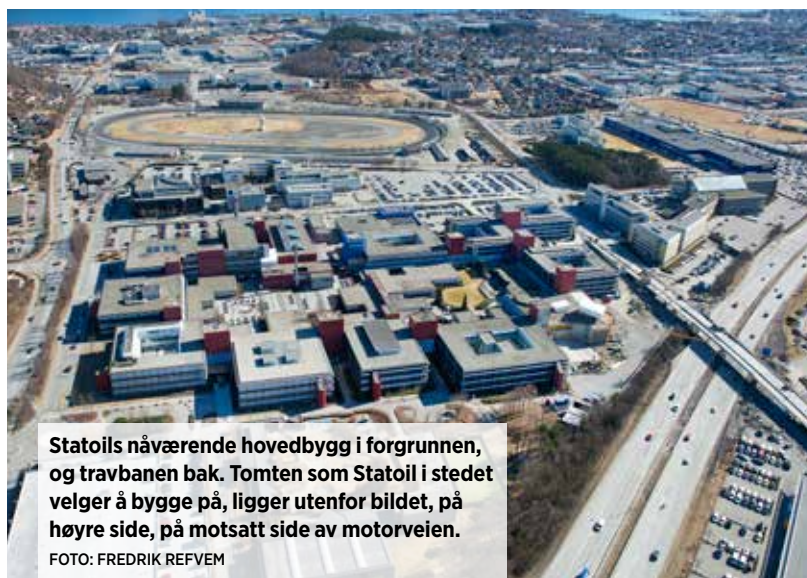
Statoils nåværende hovedbygg i forgrunnen, og travbanen bak. Tomten som Statoil i stedet velger å bygge på, ligger utenfor bildet, på høyre side, på motsatt side av motorveien.